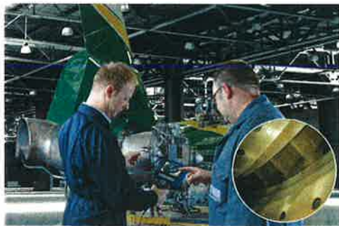
MoVeo ビデオスコープを使用したヘリコプター用エンジン検査

カールストルツは非破壊目視検査における総合サプライヤーへと大きな成長を遂げました。その結果、カールストルツ製品は多くの産業部門やアプリケーションで使用され、ユーザーの設備の稼働を確保して生産性を高めるソリューションを提供しています。