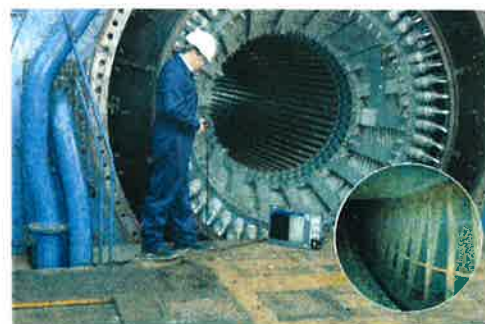
ビデオスコープとTECHNO PACK® T LEDドキュメンテーションシステムを使用した大型発電機用スターターモーターハウジング検査