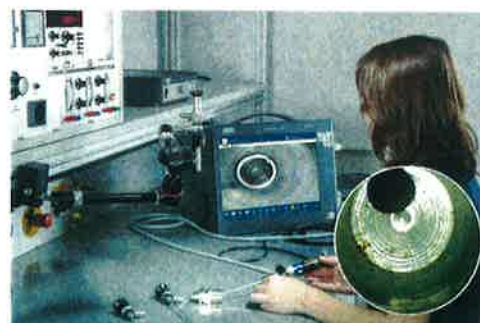
ボアスコープと TECHNO PACK® T LED ドキュメンテーションユニットを用いた工具構成部品の検査