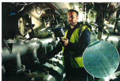
MoVeo ビデオスコープを使用した潜水艦ディーゼルエンジン検査