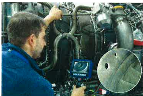
MoVeo ビデオスコープを使用した航空機タービンの検査