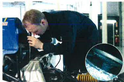
ボアスコープを使用したエンジン構成部品の検査